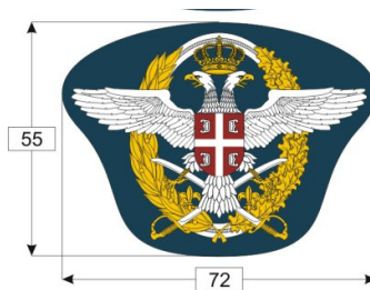
Слика 2 – Изглед и димензије ознака за бере и капу припадника РВиПВО